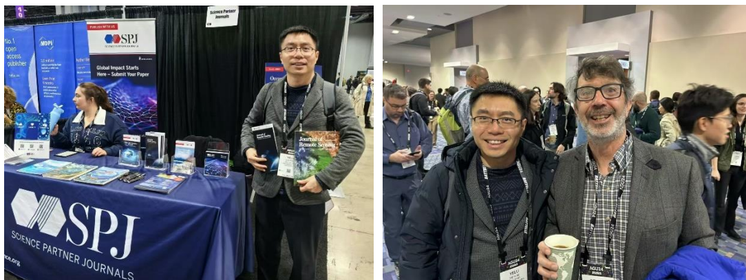
参加 2024 美国地球物理年会 (AGU) 照片